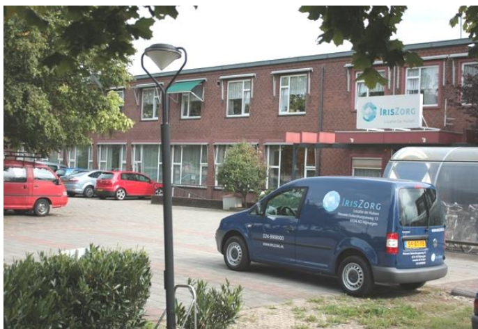
Iriszorg Nieuwe Dukenburgseweg Nijmegen

In de locaties waar men korter dan drie maanden woont of waar ambulante cliënten komen, is het moeilijk om cliënten te vinden die een bewonersraad willen opzetten. Op die locaties heeft de CZ een maandelijks spreekuur ingesteld en kunnen alle cliënten met collectieve klachten bij hen terecht en ook hier wordt dankbaar gebruik van gemaakt.